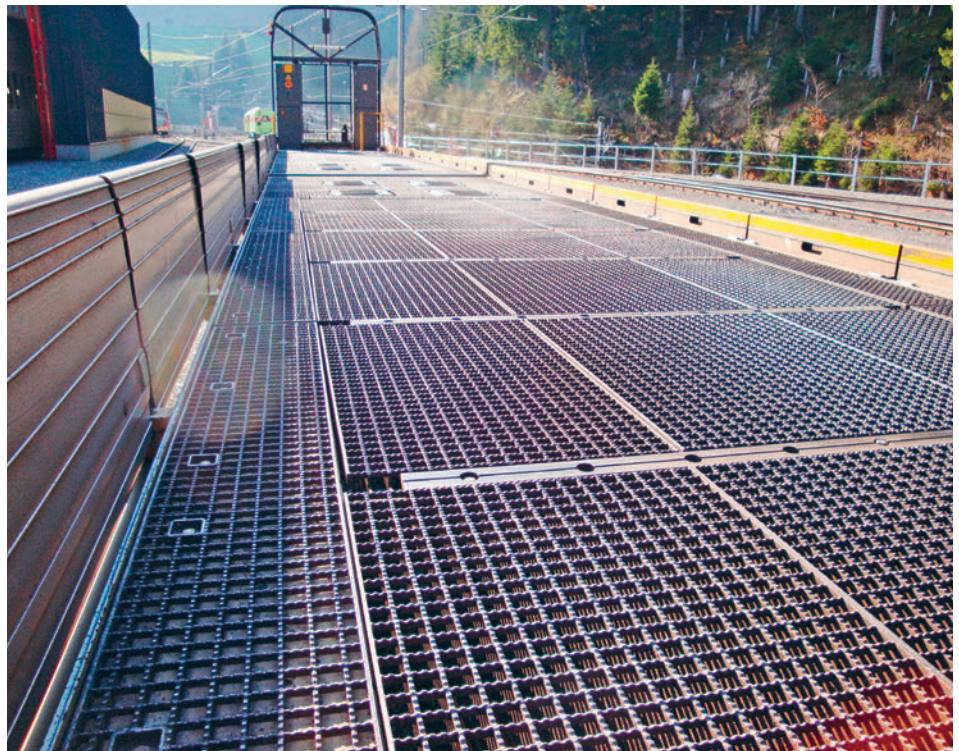
Mit Sprich-Schwerlastrosten ausgestattete Bahnwagen durchfahren mehrmals täglich den Vereinatunnel.

Für dieses umfangreiche Projekt musste exakt geplant werden. Alle Bahnwagen der unterschiedlichen Typen wurden hierbei vermessen und Ausschnitte sowie mögliche Befestigungen mussten pro Gitterrost festgehalten werden. Im Vorfeld erfolgten dann der Bau und